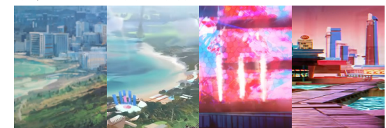
A B C D

9. 汐斯塔虽然法理上是哥伦比亚的一部分，但其夹杂在几个大国之间的复杂情况使其略显尴尬，并且在一部分问题上其市长也并不打算服从哥伦比亚政府。以下活动PV截图中，哪一个与汐斯塔无关