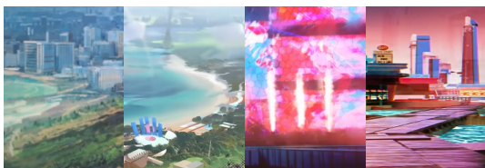
A B C D

9. 汐斯塔虽然法理上是哥伦比亚的一部分，但其夹杂在几个大国之间的复杂情况使其略显尴尬，并且在一部分问题上其市长也并不打算服从哥伦比亚政府。以下活动PV截图中，哪一个与汐斯塔无关